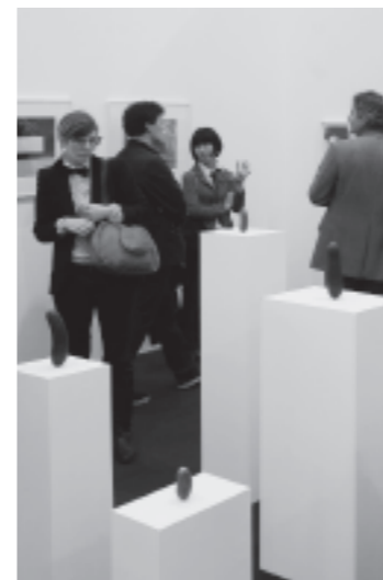
Begegnung mit Erwin Wurms »Selbstporträts als Essiggurker!«