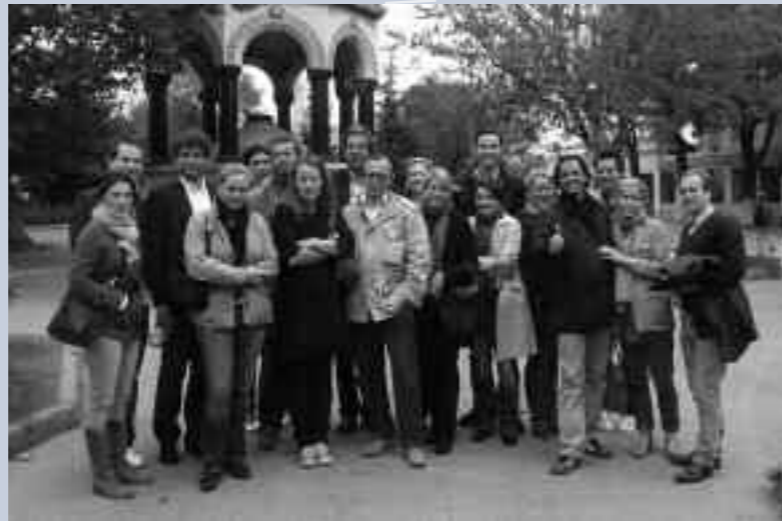
Die jungen Sprengelfreunde in Istanbul